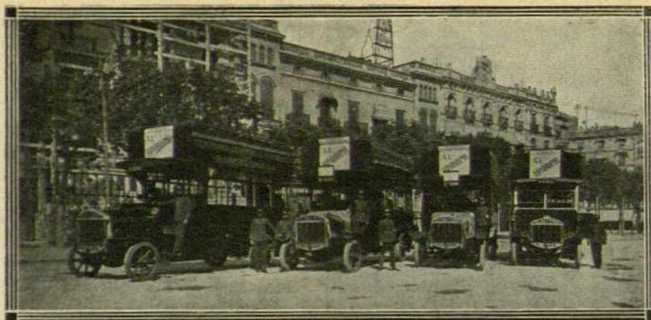
Els quatre magnífics autòmnbis destinats ja actualment a serveis extraordinaris